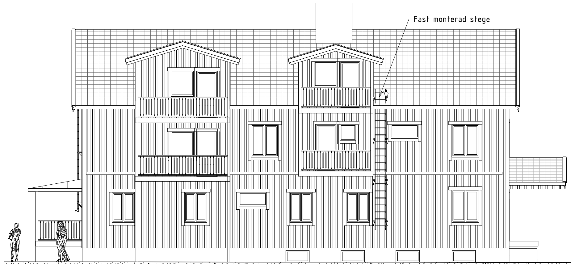
Fasad mot Nordöst